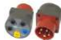
Adapter gniazd trójfazowych 16 A / 32 A