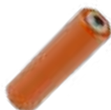
4x bateria LR6 1,5 V