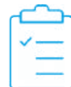
Świadectwo wzorco- wania z akredytacją