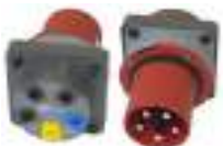
Adapter gniazd trójfazowych 63 A