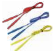
Przewód 1,2 m (wtyki bananowe) czerwony / nie- bieski / żółty