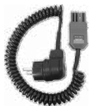
Adapter WS-05 (wtyk kątowy UNI-Schuko)