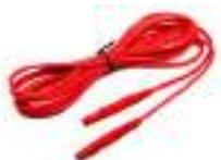
Przewód do pomiaru pętli zwarcia (wtyki bananowe) 5 m / 10 m / 20 m