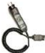
Adapter WS-03 wyzwalający pomiar (wtyk UNI-Schuko)