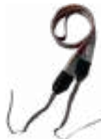
Szelki do mier- nika (typ M-1)