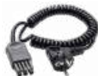
Adapter WS-04 (wtyk kątowy UNI-Schuko)