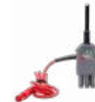
Adapter WS-07 do pomiaru impe- dancji pętli Z(L-N)